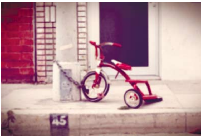
丁丁對台灣的很多期許來自侯孝賢和吳念真的光影，來自簡嫻和蔣曉雲的文字。（網路圖片）

而說起生活上在台灣的融入，丁丁也泛起了一絲矛盾。她在主觀上非常想要交到一些台灣的好朋友，兩個月以來，也受到了很多台灣朋友的幫助，他們都熱情耐心地回答她所有的問題，周到地讓人感動。但從客觀來