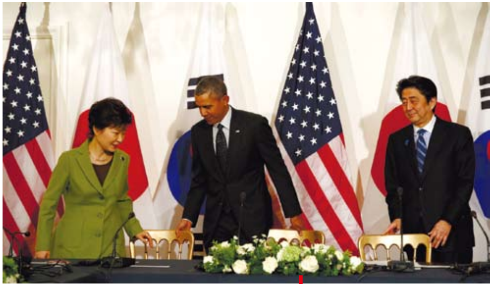
朴槿惠自上任以來，尚未與安倍舉行正式的首腦會談。圖為2014年3月，在美國的主導下韓美日三國領導人在荷蘭海牙舉行首腦會談。

由於日本政府一直拒絕向「慰安婦」倖存者道歉和賠償，朴槿惠政府實際上把解決「慰安婦」問題作為韓日首腦會談的前提。朴槿惠自2013年2月上任以來，除了在一些多邊會議上同安倍會面，尚未與安倍舉行正式的首腦會談。