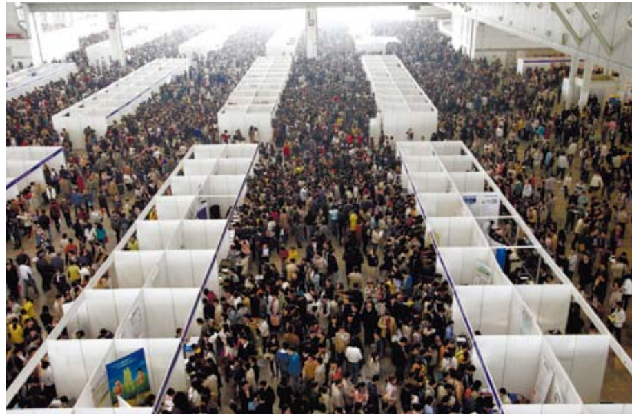
每年3月份起，大陸許多大學會舉辦企業招聘會，畢業生現場填報簡歷，然後等待用人單位的回覆。