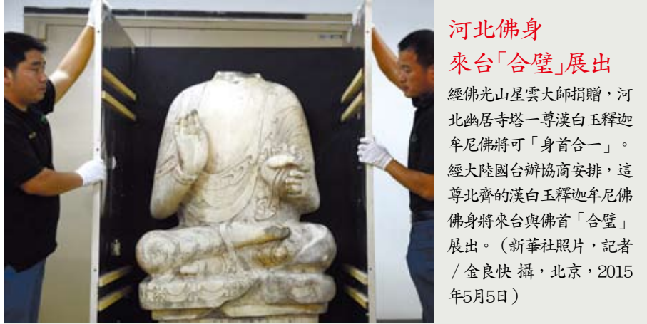
河北佛身來台「合璧」展出 經佛光山星雲大師捐贈，河北幽居寺塔一尊漢白玉釋迦牟尼佛將可「身首合一」。經大陸國台辦協商安排，這尊北齊的漢白玉釋迦牟尼佛佛身將來台與佛首「合璧」展出。（北京，2015年5月5日）

兩岸和平發展的現狀，是兩岸關係由武裝割據走向和平統一的過渡，是一種中介型態，而所有事物變遷過程的中介形態，必然要消失在結果當中。選擇「和平發展」還是「和平對抗」，最終是和平與戰爭的抉擇，蔡英文有必要跟台灣人民說清楚、講明白。