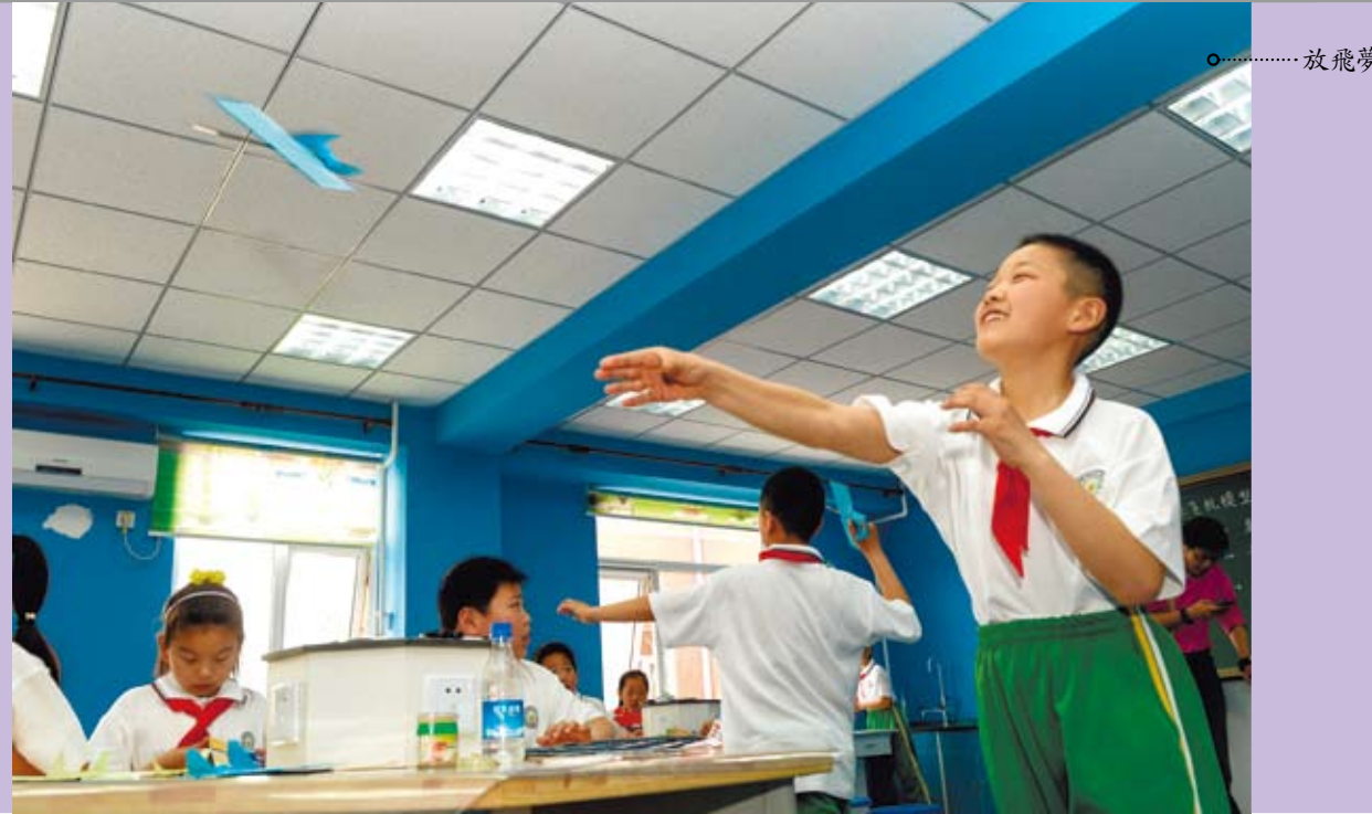
放飛夢想——航空科普教育系列活動走進打工子弟小學。圖為4月30日，北京豐台區成壽寺小學學生在航模課上「試飛」自己製作的紙飛機。

4月20日一份由中國大陸知名教育學者、北京理工大學教授楊東平主編的《教育藍皮書》（全稱為《中國教育發展報告2015》）在北京發佈。《教育藍皮書》指出，大陸貧困地區學齡兒童身體健康的兩大隱憂主要還是衛生習慣不良和營養搭配不合理兩個問題。此項調查覆蓋大陸東中西部20個省份，抽樣為省會城市小學1至2所，每個省1至2個貧困縣，每個貧困縣至少1所鄉鎮中心小學、村小或教學點。此次調查共包括88所小學，對這88所小學校長、560名教師進行問卷調查及訪談，學齡兒童的調查對象是在校6至14歲的小學生。《教育藍皮書》的公佈，讓中國大陸當前的教育現況再次成為媒體和輿論的焦點。為了讓台灣讀者掌握大陸教育最新的情況、當前政策走向與未來的發展，本版特別以「《2015教育藍皮書》與中國教育改革年」為題，重點介紹大陸教育現況。