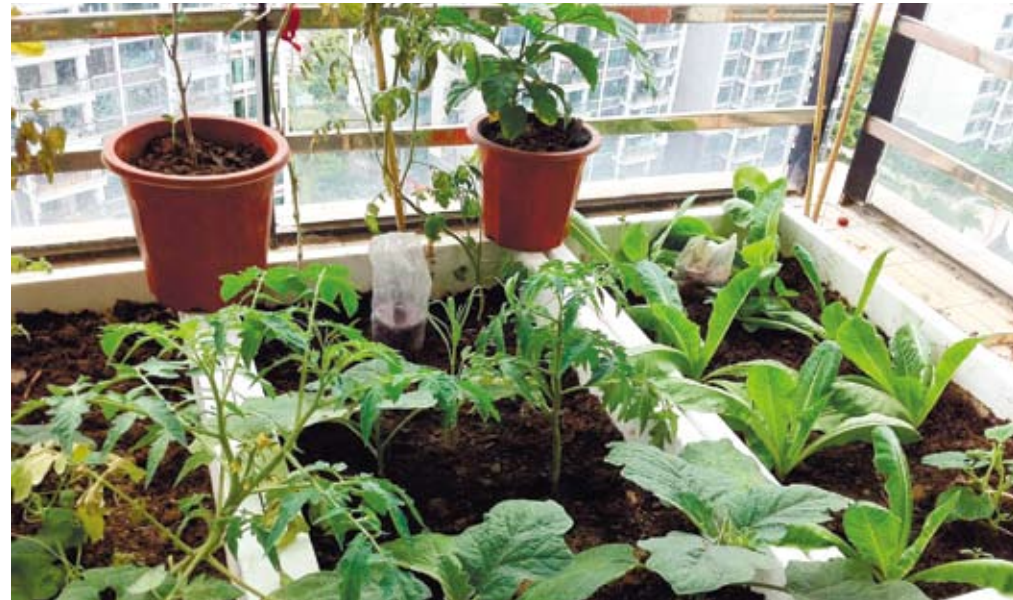
春天到來，不少城市白領開始利用午休時間在辦公室擺弄花草、在陽台除草培土伺候蔬菜或者到城市郊區體驗農活。

財貿金融、IT、地產、現代服務業需求較往年增加，農林、醫藥行業人才需求穩定，師範類就業壓力仍然很大。可見，企業更傾向於具有實操能力的人才。眼下，對於畢業生而言，在掌握專業知識以外增強實操能力，擁有一技之長才能提高應聘的成功率。對於企業用人單位而言，則應為應屆生們提供一些時間和機會，所謂「高山不辭杯土，大海不拒細流」，只有以包容和平等的心態對待初出茅廬者，才能將他們培養成有用之才。從長遠角度來看，大學生就業難的「治本」之道，必須以調整經濟結構和深化高等教育改革為重點，通過報簡歷，然後等待用人單位的回覆。然而，大多數參加招聘會的畢業生表示，「簡歷填了很多份，但是卻等不到回覆」。除了關注各高校的招聘會外，學校招聘網站、校內網以及同學之間的信息共享，也是畢業生獲得招聘信息的主要管道。但是，無論哪種應聘方式，都存在簡歷回覆寥寥無幾的現象，部分學生表示，投簡歷難，等回覆難，找工作真難，找個好工作更是難上加難。造成就業難現象的原因，歸根結底是高等院校培養的人才與勞動力市場需求不相適應。現在，大陸本科院校都以培養研究型、學術型人才為主，學生們在學校接受的日常教育過於重視理論，然而勞動力市場最緊缺的是技術型人才。從今年畢業生的就業專業來看，理工類專業占需求主體，