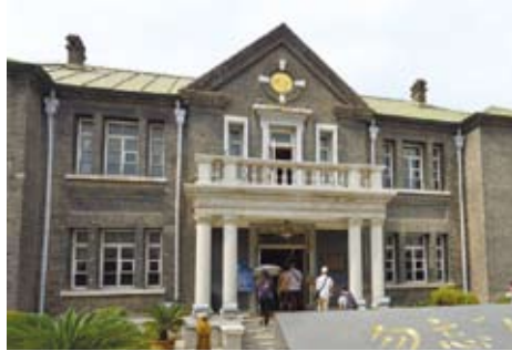
偽滿皇宮部份建築