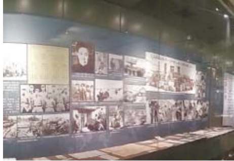
東北沦陷史館內展示