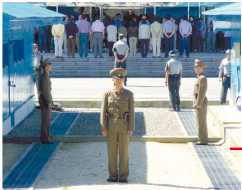
圖為駐守在板門店的北韓軍人（面對者）與南韓憲兵（背對者）。微微凸起的門框即為軍事分界線。